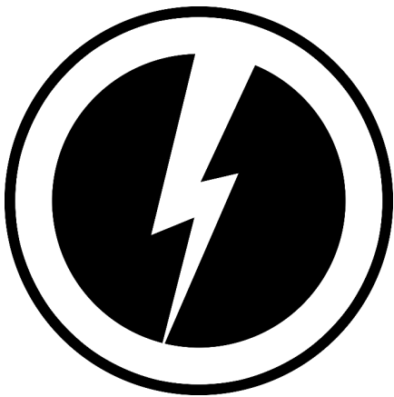
Logo du Blocco studentesco

Leurs vêtements nous le confirment, depuis les t-shirts du Blocco studentesco (Bloc étudiant), la branche jeunesse de CasaPound Italia, aux patchs aux couleurs du drapeau italien en passant par les vêtements de la marque Pivert, étroitement liée à CasaPound Italia. Une des figures emblématiques de ces jeunes est Francesco Polacchi, ancien chef du Blocco studentesco qui, en 2009, a pris la tête des affrontements contre les étudiants du mouvement de l'Onda (« La Vague »), fondé pour protester contre les coupes du gouvernement Berlusconi dans le budget de l'Éducation et