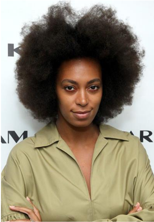
SOLANGE KNOWLES CHANTE « DON'T TOUCH MY HAIR »

L'utilisation d'internet et des réseaux sociaux a créé une forme de cyber-socialité noire. En France, les divers podcasts (Le Tchipe, Kiffe ta race) et vidéos YouTube consacrés à la race et plus spécifiquement à la question noire en sont les manifestations les plus éloquentes. Y interviennent des personnes qui ont acquis des connaissances livresques par le biais de cursus universitaires ou en autodidactes. Ils incarnent une nouvelle forme d'affirmation de conscience politique noire qualifiée de wokeness . Le fait d'être woke (« éveillé.e » en anglais vernaculaire africain américain) consiste à partager ou à acquérir une connaissance des exactions qu'ont subies et que subissent encore les populations noires. La wokeness suppose aussi d'être au fait de textes académiques engagés et de subcultures artistiques militantes noires. L'objectif est d'identifier et