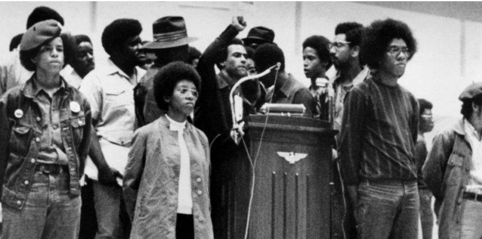
BLACK PANTHER PARTY

La revalorisation du cheveu crépu a malgré tout simultanément et durablement popularisé la critique des techniques capillaires proposées aux femmes et, dans une moindre mesure, aux hommes noirs, au motif qu'elles consistent à cacher les cheveux sous des artifices ou à en modifier la texture. Les militants noirs ont ainsi en partie exposé les mécanismes historiques, sociaux et politiques qui ont conduit à imposer l'idée selon laquelle les cheveux des no.i.r.e.s sont anormaux. Ce qui questionne avec le recul, c'est qu'il ait pu être perçu comme révolutionnaire ou malséant – et c'est d'ailleurs encore le cas – de ne pas modifier la texture de ce type de cheveux, alors qu'ils sont génétiquement programmés pour pousser ainsi.