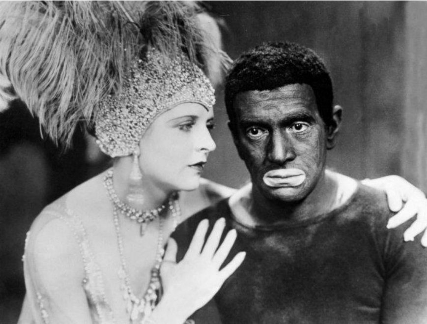
BLACK FACE : « LE CHANTEUR DE JAZZ » (1927)

témoignant d'une méconnaissance de l'histoire antique. En tout état de cause, cette polémique illustre la diffusion d'une nouvelle grille de lecture antiraciste et les modalités singulières de sa traduction en France.